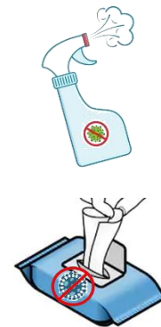
Producto virucida para superficies