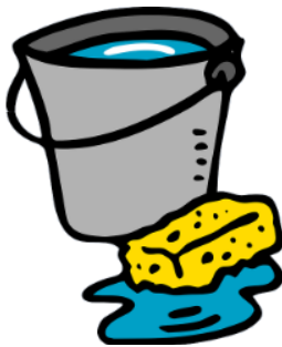
Agua y Jabón, en cantidades moderadas