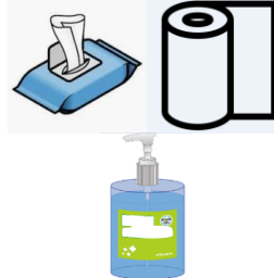
Toallitas desechables desinfectantes o bayetas desechables de un solo uso y gel hidroalcohólico para higiene de manos.. Un recipiente cerrado para tirarlos.