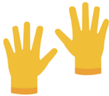
Uso de guantes desechables